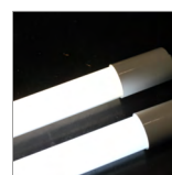
diody LED o zwiększonej wydajności