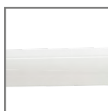
szkło w kolorze mlecznym