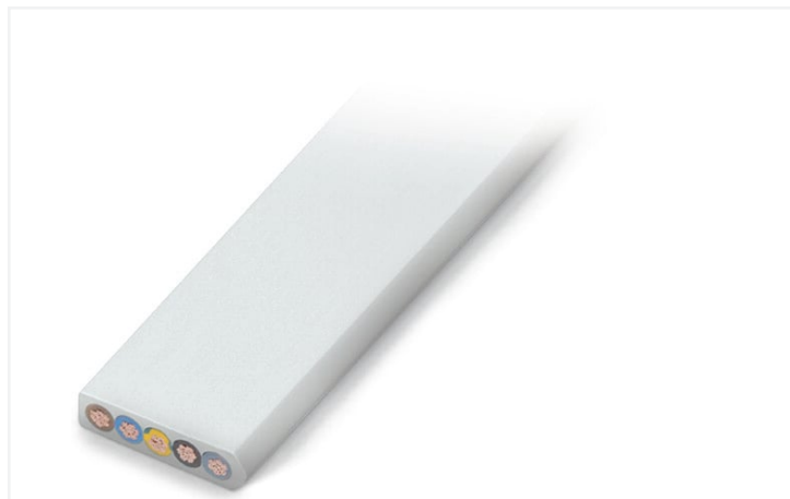
Barva: ■ Světle šedá