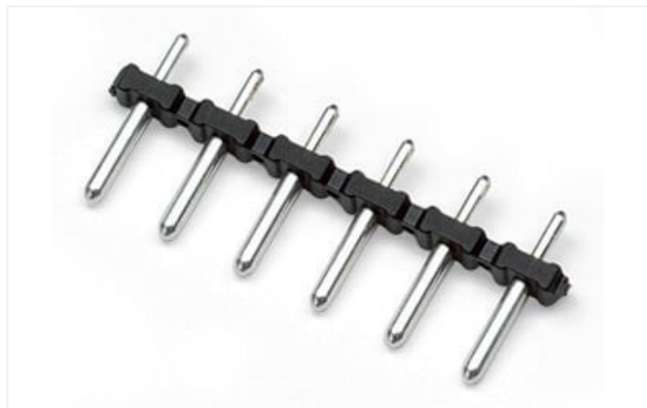
Barva: ■ Černá