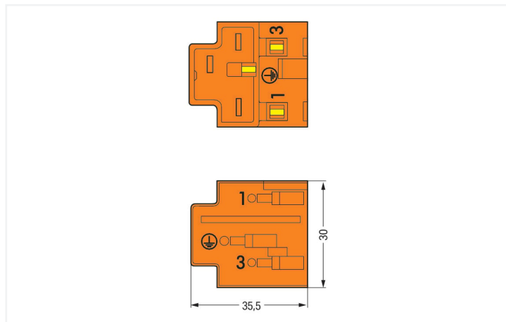
Rozměry v mm