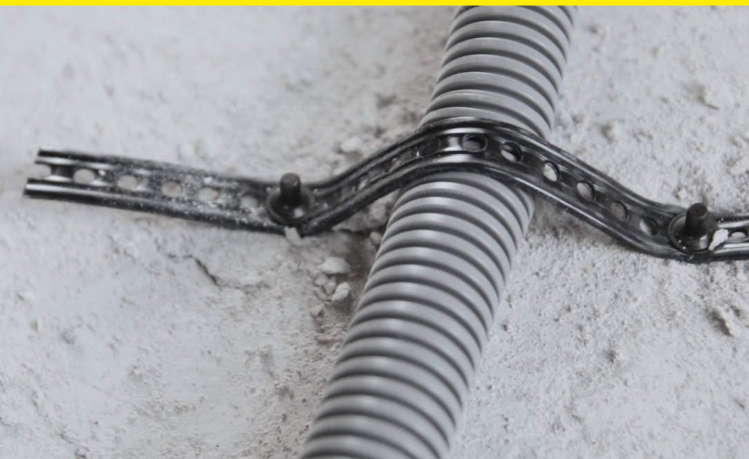
Montážní páška - MP