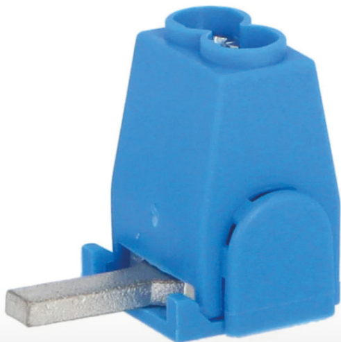
Připojení do přístrojů pomocí konektoru kolík (jazýček)