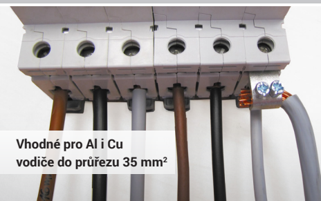
Vhodné pro Al i Cu vodiče do průřezu 35 mm 2