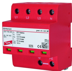
Zobrazení je nezávazné