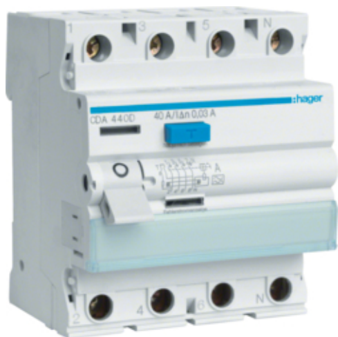
Proudový chránič 4 pól. 40 / 0,03 A, A