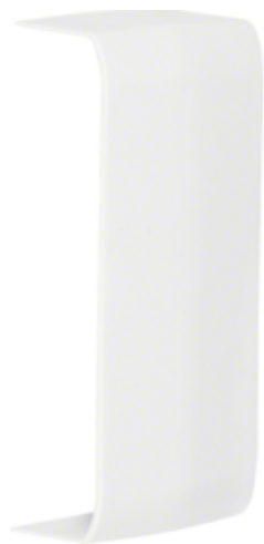
Spojka lišty ATEHA 12x50, bílá