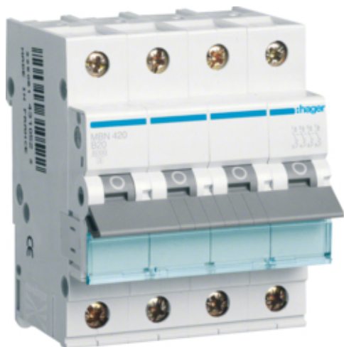
Jistič 4 pól. 20A, char.B, 6 kA