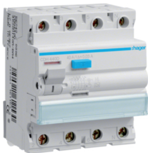
Proudový chránič 4 pól. 40 / 0,03 A, A, HI