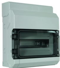
Zobrazení je nezávazné