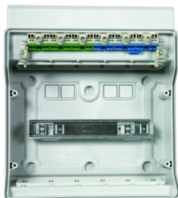
Integrované konektory pro vodiče N a PE.