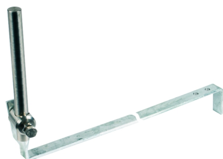
Zobrazení je nezávazné