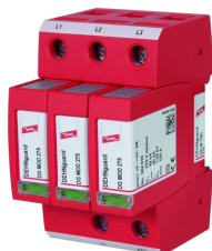
Zobrazení je nezávazné