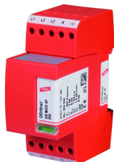
Zobrazení je nezávazné