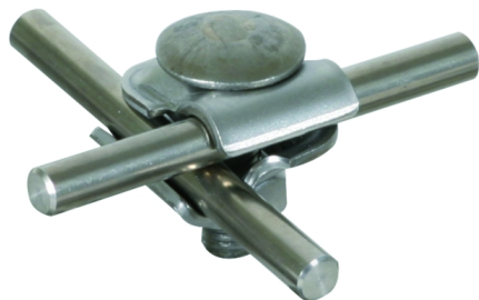
Zobrazení je nezávazné